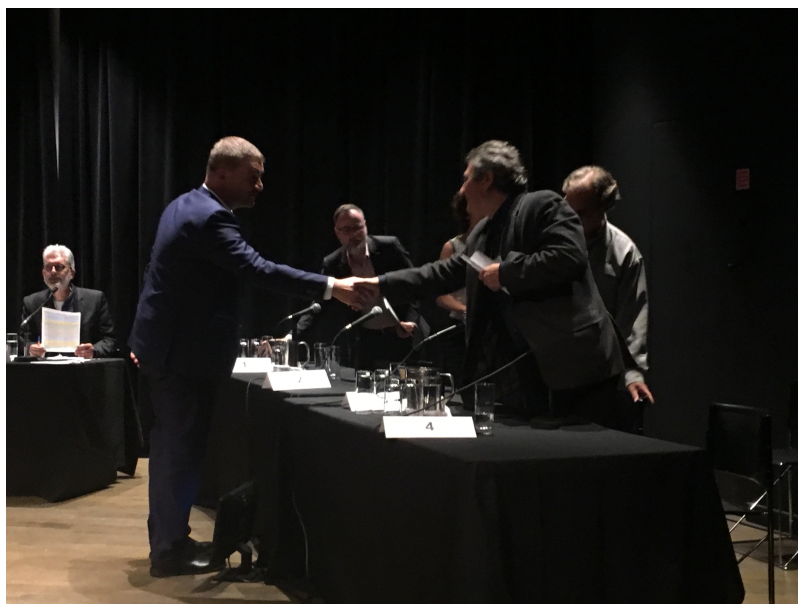
Monsieur Luc Fortin, ministre de la Culture et des Communications,

Le 5 septembre dernier, notre président Luc Fortin était présent lors du forum national de consultation sur le projet de politique québécoise de la culture. Celui-ci a porté son intérêt sur deux points du projet de politique culturelle; il s'agissait d'améliorer la condition socio-économique des artistes et de soutenir une production répondant à des hauts standards de qualité.